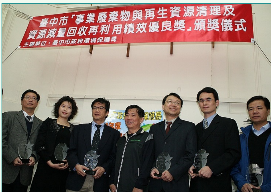
圖說：亞洲大學環安室參加臺中市政府「100年事業廢棄物清理及資源減量回收再利用」競賽，榮獲績效優良獎。